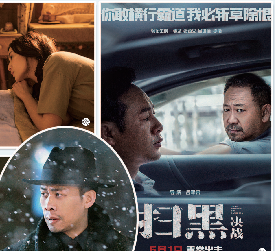
③来自喜剧阵营的《阳光劫匪》。 ④张艺谋首部谍战大片《悬崖之上》。 ⑤部分取材自全国扫黑除恶专项斗争的《扫黑·决战》。

片内容高度看好，才敢选择如此有魄力的发行方式。 《悬崖之上》何以自信？打开主创名单，导演张艺谋不待言，主演张译、于和伟、秦海璐、朱亚文、刘浩存、倪大红、李乃文等，几乎都是演技与观众缘的保证。而影片在东北零下40℃的自然环境中实拍，确保了画面中所有人与物的“冷感”。从面部的呼气成霜，到一众人等在林间及膝深的积雪中械斗，再到漫天风雪中的哈尔滨谍战，实景与冷峻的光影为故事铺就肃