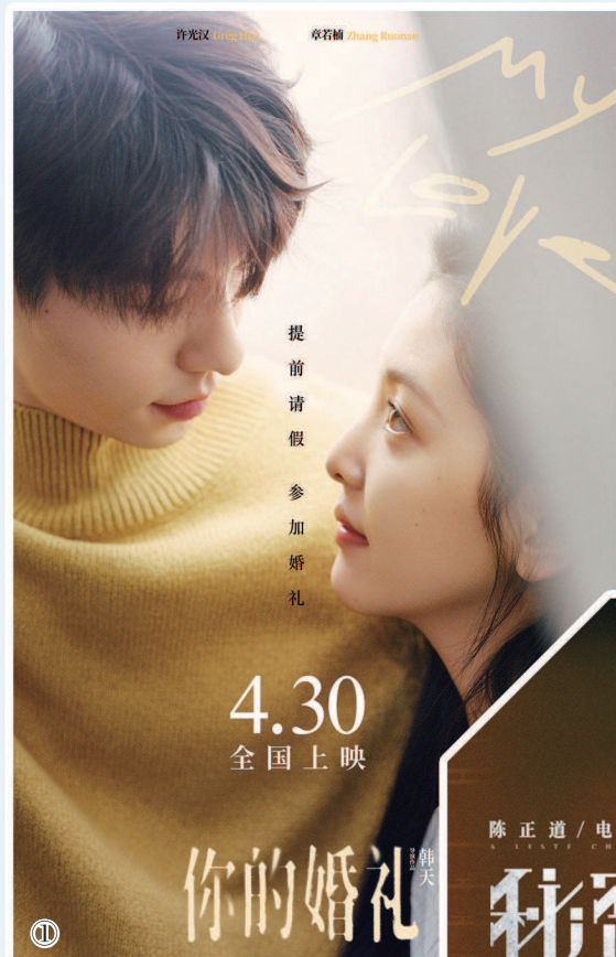
①购票平台上“想看”总人次超过120万的《你的婚礼》。 ②陈正道“悬疑三部曲”终篇《秘密访客》。

在当下这个新片口碑发酵只需半天的电影市场里，启用多轮大规模点映，已许久没有影片这样做了。原因只有一个：过于冒险。万一口碑不尽如人意，很可能令影片在激烈档期里出师未捷身先死。更何况，《悬崖之上》还是都带有悬疑元素的谍战片，底牌的提前曝光、各路点评中提及的关键剧情，都有可能折损观影体验进而拖累口碑。敢在正式上映时带着半个月发酵后的口碑入场，只有对影