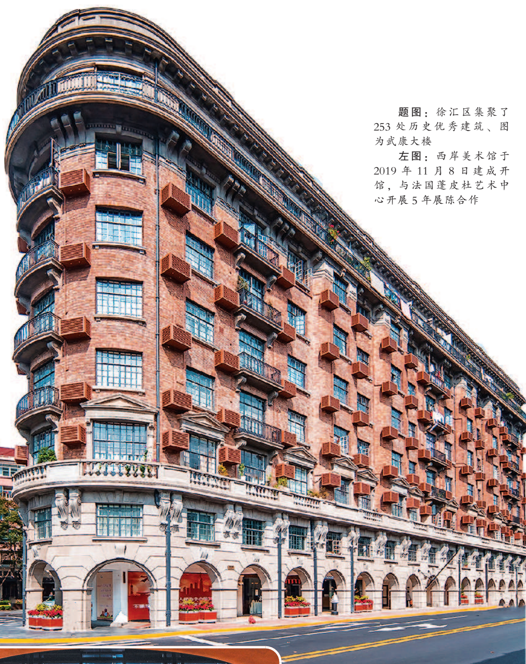
题图：徐汇区集聚了253处历史优秀建筑、图为武康大楼

今年是“十四五”开局之年，徐汇区将以促进文旅消费为关键抓手，夯实文旅消费数字化转型基础，加快消费载体智能化升级，推动创新成果落地；推进文旅消费多元化供给，鼓励新品、优品、精品创作，完善“文旅+”产业链，持续打造文旅消费热点；打造文旅消费品牌，加快核心消费集聚区建设，发掘新兴消费增长点，强化服务保障和市场监管机制，以国家文旅消费示范城市建设为引领，为文旅产业新一轮发展积蓄新动能，实现新跃级。