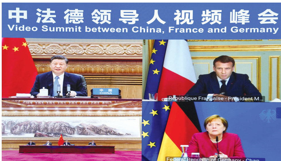
4月16日下午,国家主席习近平在北京同法国总统马克龙、德国总理默克尔举行中法德领导人视频峰会。