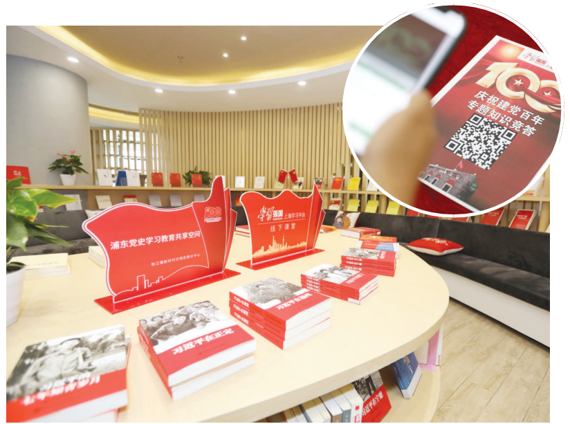
启动仪式现场,基层党员纷纷扫描二维码参与党史学习教育知识竞答。

光学知识还不够,还要学得有趣。据介绍,竞答活动共有线上参与和线下比拼两种方式,分三个阶段进行。第一阶段为线上个人赛,持续到5月中旬; ▼ 下转第五版