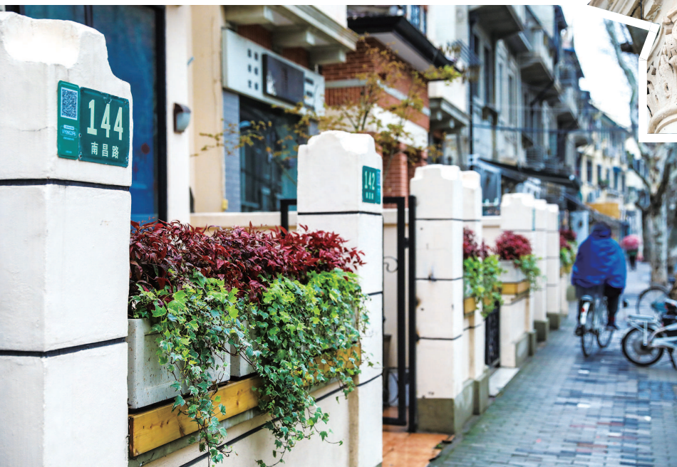
▲南昌路老洋房随着微更新进行了一系列修缮和保护,遵循修旧如旧原则。 ▲沿线新增的植物景观盆栽显示出微更新中的细节巧思,为街道增添了别样氛围。