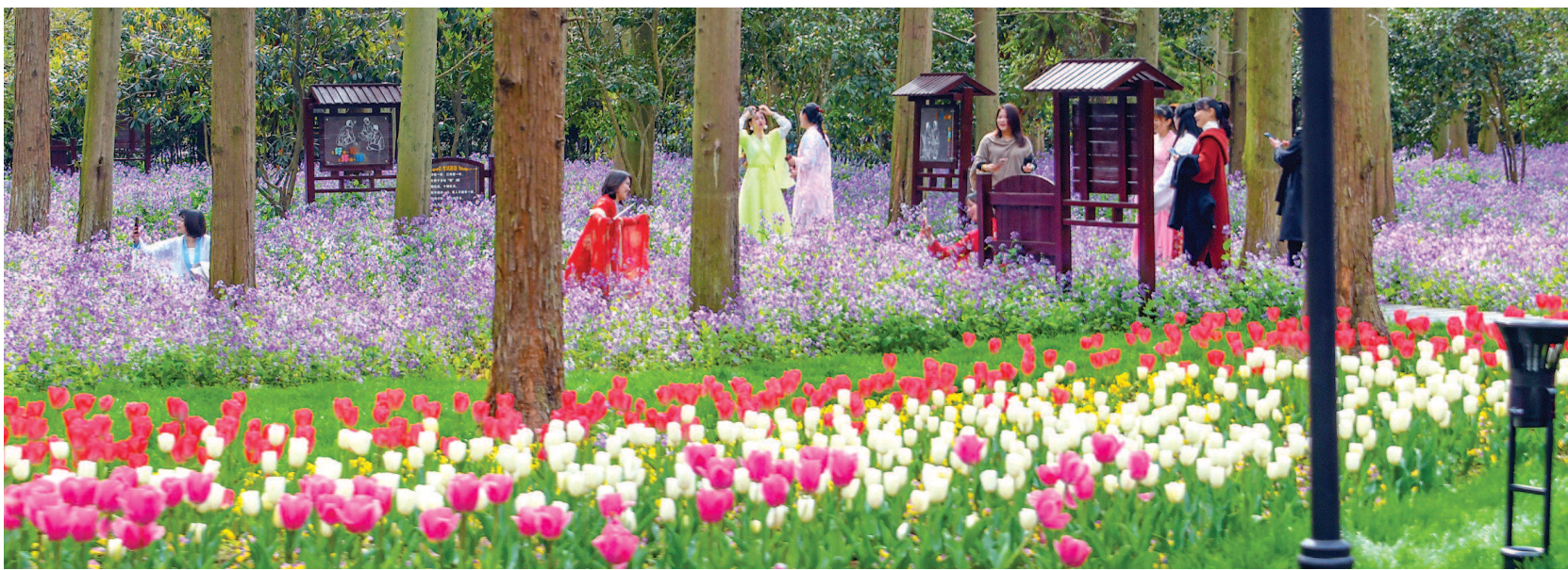
2021 崇明花朝节在东平国家森林公园拉开帷幕,让游客享受到“蝶蝶悠悠闲自乐”的舒适惬意。

以花为媒,以花兴业,以花会友。今年5月21日,2021年第十届中国花博会将在上海崇明区举行。作为第十届中国花博会的重要预热活动,2021年崇明花朝节昨天开幕,将持续至5月20日。在昨天举行的崇明花朝节开幕式上,进花门、敬花茶、戴花环、道万福、过花道、赏花歌、品花糕、花朝节祭祀仪式表演等系列沉浸式花文化一一演示,依托花博南园(东平国家森林公园)的“花海蝶舞”,为游客带来沉浸式古俗体验,享受到“蝶蝶悠悠闲自乐”的舒适惬意。在活动安排方面,崇明花朝节将启动首届中国国际花境大赛,举办首次长三角市民花园展览,推出39个中外花境作品和30个长三角市民花园。