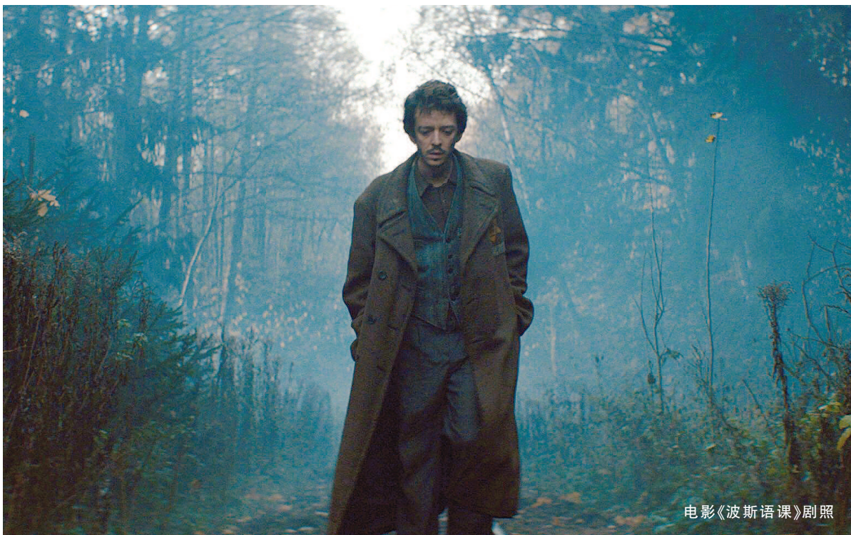
电影《波斯语课》剧照

死难者的名字成为语言，语言打捞出与人的记忆。这是过往的大屠杀题材中未出现过的视角。这不是一个完全虚构的故事，“用名字捏造语言”是真实存在过的幸存者原型，这段故事被挖掘、被讲述，既有情节离奇的吸引力，更浑厚的力量来自“名字”与“语言”承载的生命意义，在符号和隐喻的层面，它们是抵抗死亡营恐怖往