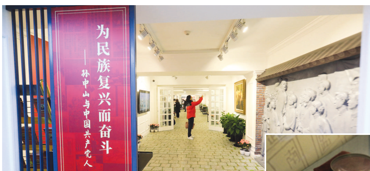
《为民族复兴而奋斗——孙中山与中国共产党人》主题展共展出150余件文物、图片、史料，及相关油画、视频等。