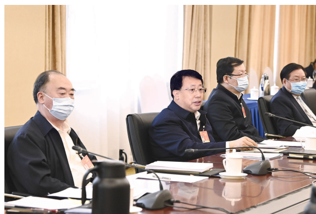
龚正代表参加上海代表团审议。

直面深层次矛盾和问题,明确了发力点和突破口,把保障和改善民生摆在突出位置,充分彰显了我们党一以贯之的初心和使命。要深入贯彻落实习近平总书记考察上海重要讲话和在浦东开发开放30周年庆祝大会上重要讲话精神,把规划建议和规划纲要紧密结合