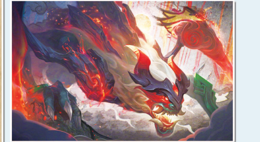
中国风设计“山海经”游戏皮肤的灵感源于古书《山海经》。制图:李洁