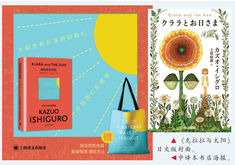
▲《克拉拉与太阳》日文版封面。 ▼中译本书店海报。

上海译文出版社线上线下齐发力,首印十万册投入市场。封面在原版图样的基础上,创新设计了镂空精装封套,使得画面更有立体感。无论是天猫旗舰店投放的300万本资金封面毛边本限定款,上线20秒便一抢而空;还是电商平台预售搭配的布面珍藏版《长日将尽》赠品,都被网友留言“诚意满满”。3月8日起,全国书店全面上架《克拉拉与太阳》,读者在参与首发的实体店购书会获得限定款帆布包;其中,西西弗书店还打造了一套三枚限定款书签,设计师以书中