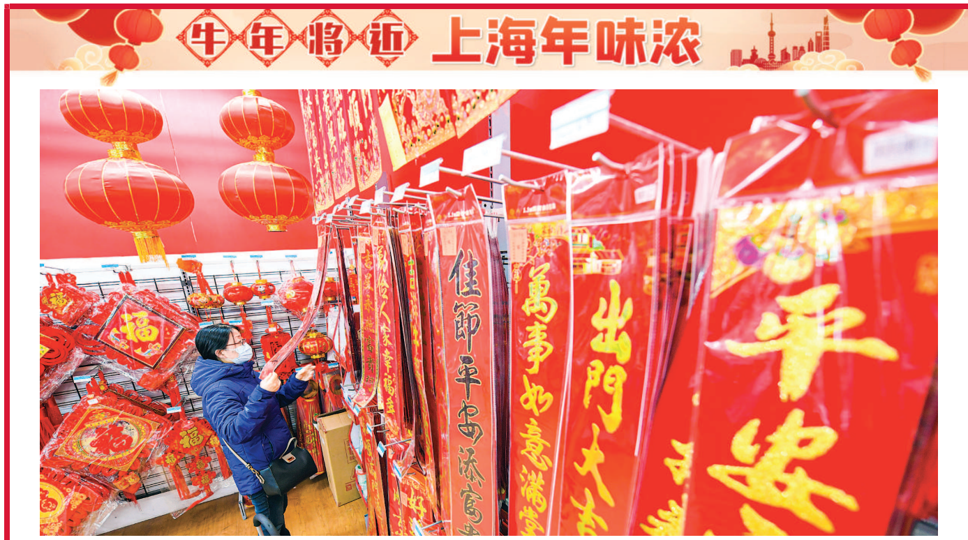
春节将近,申城年味愈发浓郁,市民加紧置办年货。图为市民在大卖场内购买春联、灯笼。