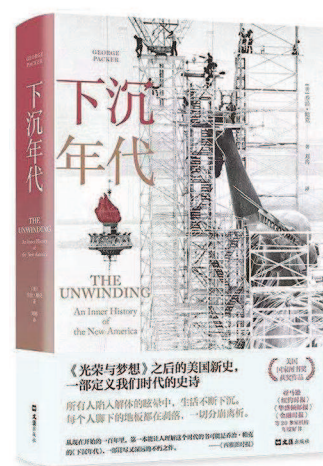
《下沉年代》[美]乔治·帕克著，刘冉译，文汇出版社，2021年1月

美国国家图书奖得主乔治·帕克跟踪四位不同阶层的60后美国人——追逐美国梦的南方白人农民，失去工厂岗位的非洲裔女性工人，在华尔街和华盛顿之间穿梭的精英，借互联网经济发迹的硅谷大佬——展现四段沉浮人生，揭开四种阶层剧痛，写出一代人的愤怒与悲哀。这是唯一一代生活在战后经济增长的黄金年代，摸爬滚打半生后，却迎来传统社会结构的轰然倒塌。阅读《下沉年代》，如同坐在第一排观看美国梦的午夜葬礼。这是献给每一个美国人的安魂曲，也是一本关于时代转折及世界剧变的当下启示录。