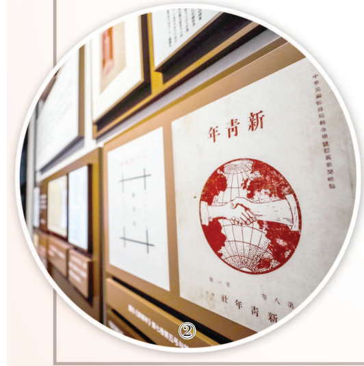
①中共四大纪念馆。 ②中国共产党发起组成立地(《新青年》编辑部)旧址内景。 ③中共一大会议址。 制图:冯晓瑜