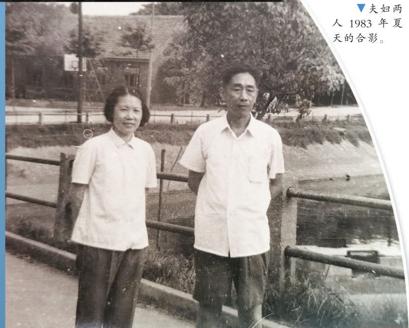
▼夫妇两人1983年夏天的合影。