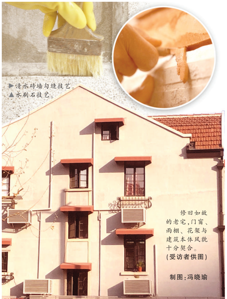
▶清水砖墙勾缝技艺 ▲水刷石技艺

当下,该基地率先提出编制历史建筑的修缮标准体系,将“可意会不可言传”的修缮工艺秘籍,以可视化、可量化的方式丰富传承,也推动老建筑修缮行业整体提升。