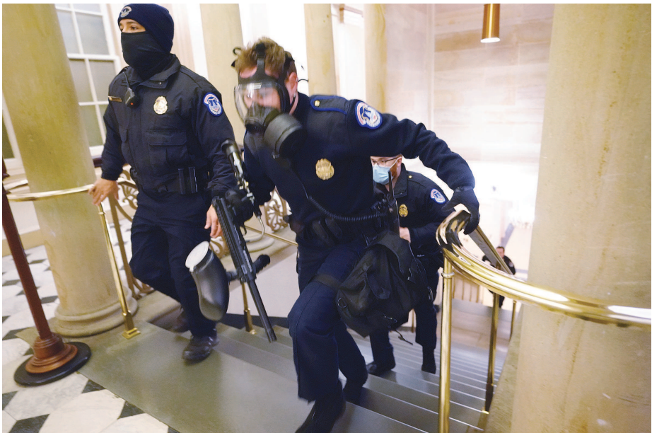
1月6日，在美国华盛顿，国会警察紧急应对闯入国会的抗议者。

美国总统特朗普支持者冲撞国会大厦事件余波未平，弹劾特朗普的风波又起。据最新消息称，民主党籍的国会众议长佩洛西10日通知副总统彭斯，如果后者24小时内拒绝援引宪法第25条修正案启动罢免特朗普的程序，众议院将于11日正式推出这项弹劾决议，并最早于13日前后付诸表决。 美国宪法第25条修正案对总统和副总统职位出现空缺时的继任程序作出规定，增加由副总统和内阁成员判断总统是否能够继续履行职务的新条款。 佩洛西当前考虑启动弹劾的罪名有二，一是拉斯金等三位众议员所提出的“煽动叛乱”，二是奥马尔、柯蒂斯两位众议员提出的“滥用权力”。