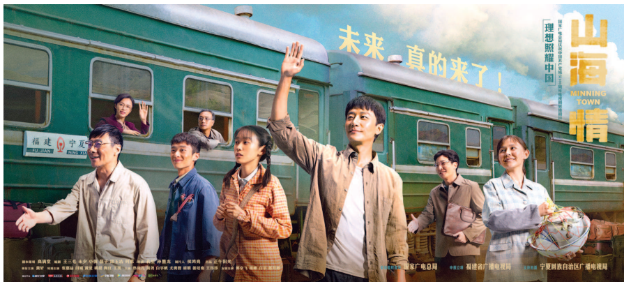
电视剧《山海情》讲述西海固的移民们在国家政策的号召下,在福建的对口帮扶下,将飞沙走石的“干沙滩”建设成寸土寸金“金沙滩”的筚路蓝缕征程。(海报)

作为“理想照耀中国——国家广电总局庆祝中国共产党成立100周年电视剧展播”剧目,《山海情》由国家广播电视总局策划组织指导,福建省广播电视局申报立项,宁夏回族自治区广播电视局支持拍摄,正午阳光出品。一批国产电视剧的中坚力量为这一重