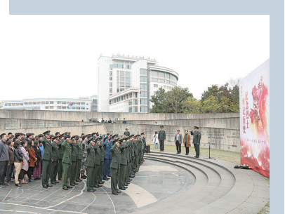
▼上海大学师生在湖南举办主题活动