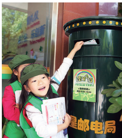
▲黄浦区蓬莱路二小打造以“蓬莱小镇”命名的校本拓展型课程，学生在“蓬莱小镇”职业体验中学生行规内化于行

全市大中小学围绕落细落小落实社会主义核心价值观教育，从课堂教学、主题活动、社会实践、校园文化、师德师风、疫情防控等环节切入，突出回归课程之本、铸就德育之魂、成于知行之道、弘扬中国精神、传递中国价值、凝聚中国力量，价值追求，涌现出一批可借鉴、可复制、可推广的示范案例、优秀案例。