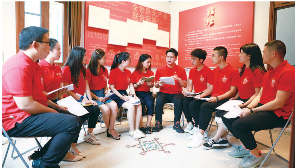
▲复旦大学《共产党宣言》展示馆党员志愿服务队集体学习