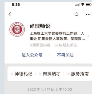
▲疫情期间上海理工大学班主任在行动！系列（八）微信推送

上海音乐学院鼓励号召广大师生充分发挥专业优势，以艺战“疫”，用音乐记录历史、书写时代、歌颂英雄和人民，创作出一大批优秀抗疫歌曲和音乐作品。