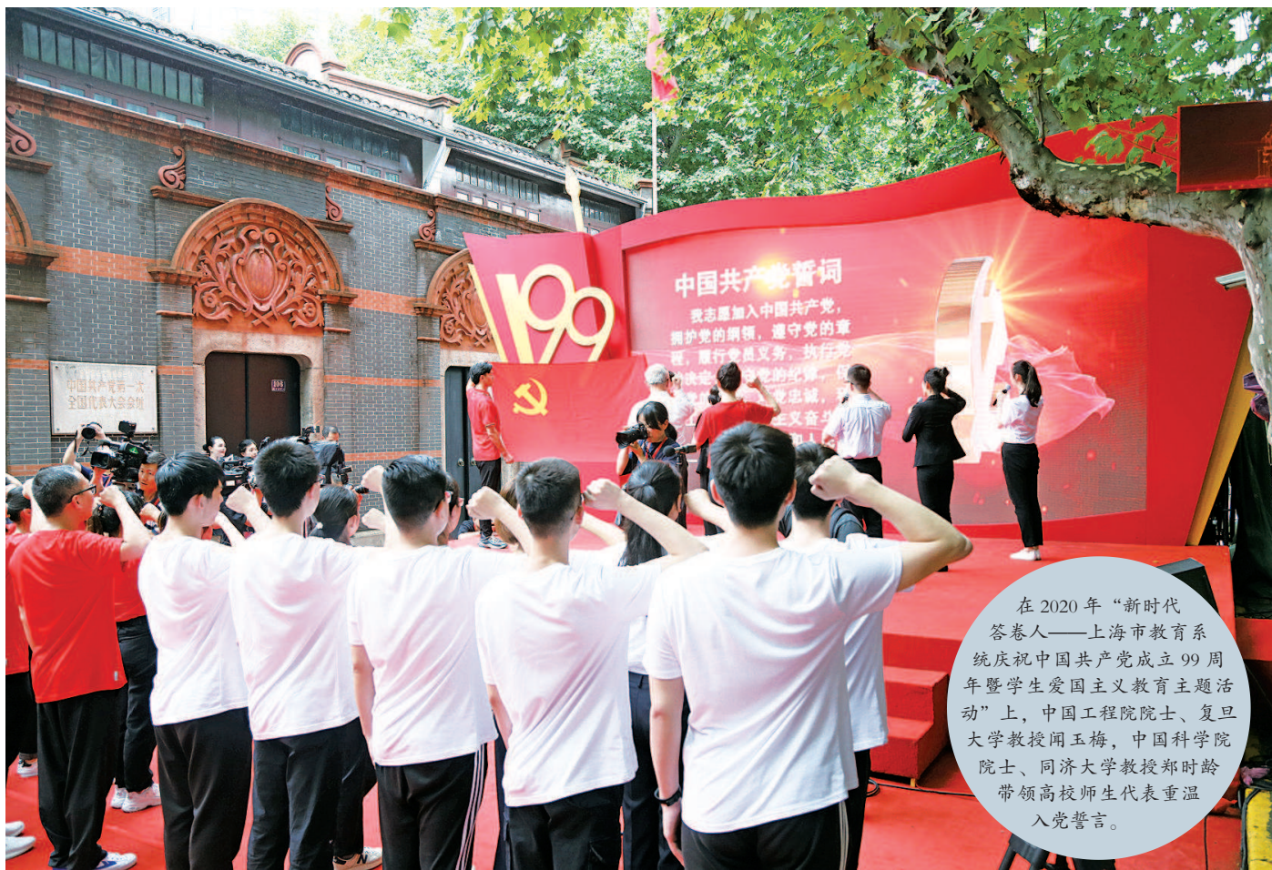
在2020年“新时代答卷人——上海市教育系统庆祝中国共产党成立99周年暨学生爱国主义教育主题活动”上，中国工程院院士、复旦大学教授闻玉梅，中国科学院院士、同济大学教授郑时龄带领高校师生代表重温入党誓词。