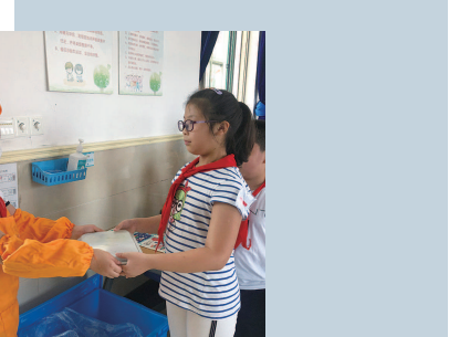
▲杨浦区建设小学小小“餐管员”按时上岗，为全班同学提供细致的服务，协助饭馆教师管理用餐秩序