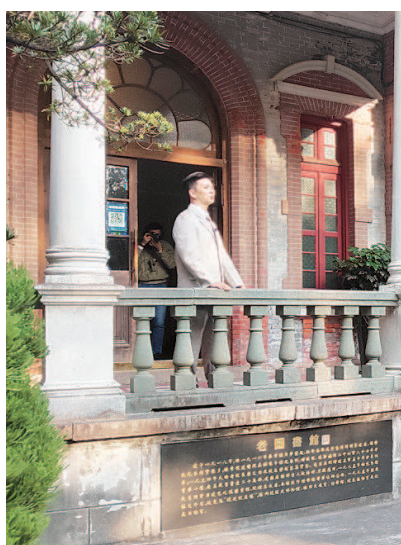
▲上海交通大学发掘校史资源唐文治老校长的故事以及解放战争时的英烈故事，利用百年历史的老图书馆，排演校园四史沉浸式剧目《循声探秘·声动交大》。