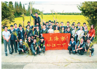
▲松江一中的“走向希望的田野——社会主义新农村建设田野调查和体验”综合实践课程让学生在劳动、田野调查中感受中国乡村巨变