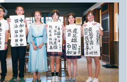
▲嘉定区封浜中学学生的书法作品展：爱国与抗疫