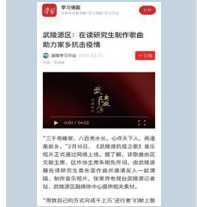
▼上海音乐学院师生充分发挥专业优势，以艺战“疫”，用音乐记录历史、书写时代、歌颂英雄和人民