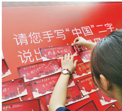
▲同济大学学生“手书中国”活动，告白祖国

牢牢把握第一课堂育人主渠道主阵地，使每一门课程都有育人功能，使每一位教师都承担起育人职责，真正实现全员育人，已经成为上海大中小学的共同目标与集体行动。