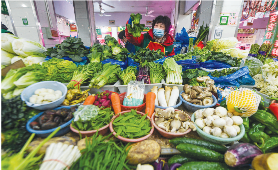
昨日，在位于虹口区长春路的三角地菜场，蔬菜供应充足，现场前来采购蔬菜的市民络绎不绝。

今天晴到多云 温度：最低-5℃， 郊区-8℃到-6℃，有严重冰冻 最高5℃ 偏西风2-3级 明天晴到多云 温度：最低-2℃ 最高7℃ 东北风2-3级