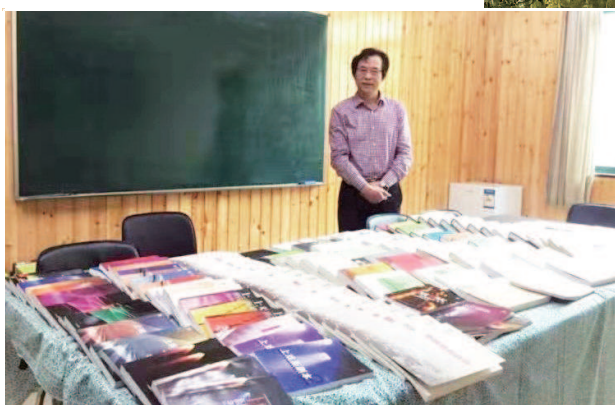
陆军教授与他编著出版的100多本书籍

再者，文化自觉又是实现文化自强的前提。只有通过文化自觉，才能实现文化自强。对一个地区来说，文化自觉主要表现为全区人民拥有共同的核心价值和崇高的理想信念，积极投身于中国优秀传统文化的现代性转换与创新性发展，以生动的实践与优异的成果建设文化强区。在加快推进长三角G60科创走廊建设的同