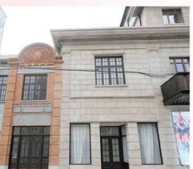
中共中央政治局机关旧址（1928—1931年） 中共中央在沪使用最久机关

在上海闹市区的云南中路上，有一排坐西朝东钢筋混凝土结构的两层沿街楼房。90多年前，中共中央政治局机关就设在这里，这是目前所知中共中央政治局在沪使用时间最长的机关旧址。