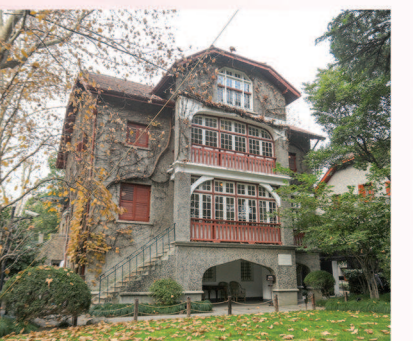
中国共产党代表团驻沪办事处（周公馆）旧址 打响看不见硝烟的战斗

70多年前的思南路，一场看不见硝烟的战斗正在打响。1946年5月，根据“双十”协定，周恩来率领中共代表团前往南京，与国民党谈判。6月，中共代表团决定在上海思南路107号设立办事处，但国民党当局不允许挂“中共代表团驻沪办事处”的牌子。董必武当即决定，不让挂牌子，就管它叫“周公馆”。