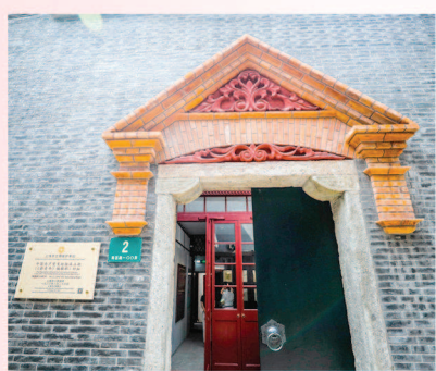
中国共产党发起组成立地（《新青年》编辑部）旧址 见证党酝酿建立的过程

其中，中国共产党发起组成立地（《新青年》编辑部）旧址、中国社会主义青年团中央机关旧址见证了党酝酿建立的过程。中共一大会址、中共二大会址、中共四大纪念馆见证了党从诞生到逐渐发展壮大而奋斗历程。中国劳动组合书记部旧址、中共中央政治局机关旧址（1928—1931年）体现了上海作为党成立后中国革命的领导指挥所所发挥的重要作用。上海毛泽东故居陈列馆、中国共产党代表团驻沪办事处（周公馆）旧址、龙华革命烈士纪念馆地见证了党许多早期领导人、仁人志士都在上海工作、战斗过，挥洒热血奉献生命。