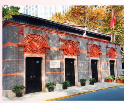
中共一大会议址 翻开中国历史开天辟地一页

1921年7月23日，平均年龄28岁的十多位代表从各地来到上海，与两位共产国际代表走入望平街上的106号（今兴业路76号），召开中国共产党第一次全国代表大会，翻开了中国历史上开天辟地的崭新一页。