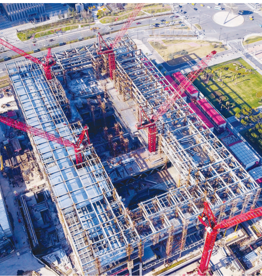
上海博物馆东馆工地施工稳步推进，钢结构已经封顶。

未来，上海博物馆将以打造“世界顶级的中国古代艺术博物馆”为发展目标。想要达到这一目标，“扩容”的不只是面积，还有功能的升级。记者了解到，上海博物馆东馆将更加注重观众的参与感和参观体验，开放式的文物展览展示使得博物馆的日常后台工作得以呈现在公众眼前。东馆还将更加注重发挥博物馆的教育功能，借鉴国外自然科技类探索馆经验，专门增设了针对青少年的体验空间，使孩子们能在互动体验中增加对中华文明乃至世界文明的认识。此外，更多的教室、图书阅览、数字影院等设施将对公众开放。