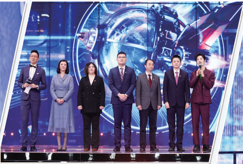
五位上海援鄂医疗队成员昨夜登上跨年盛典舞台，他们与演员黄晓明一起连线武汉，构筑舞台上动人一幕。 制图：李洁