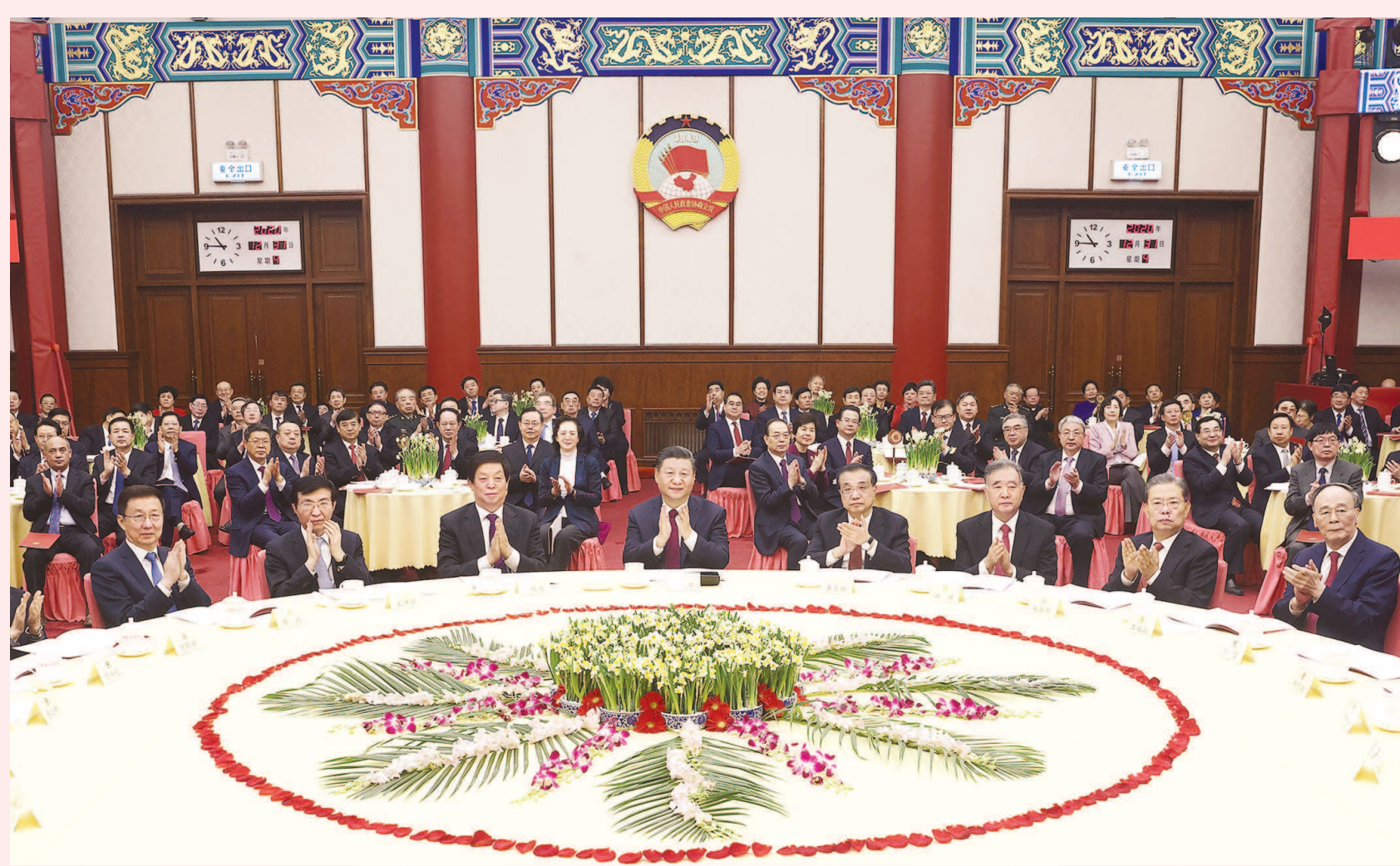
昨天，习近平、李克强、栗战书、汪洋、王沪宁、赵乐际、韩正、王岐山出席全国政协新年茶话会并观看演出。