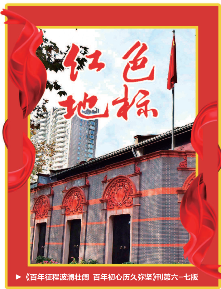
《百年征程波澜壮阔 百年初心历久弥坚》刊第六一七版