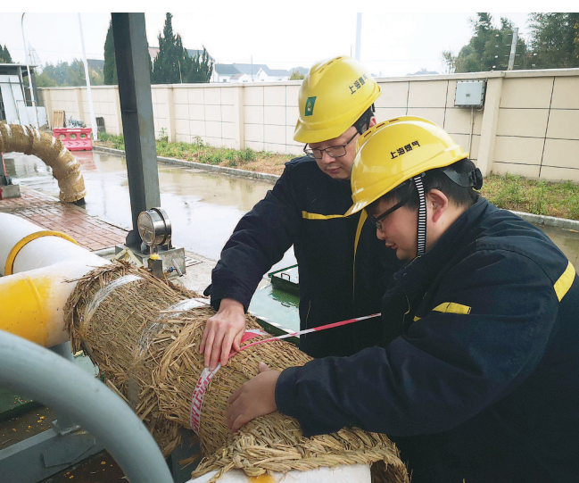
昨天，上海燃气山公司对调压设备进行防寒措施检查，对大用户和次高压调压器陆续进行加强巡检，并对有积水的调压器进行排水处理。

除了调度天然气资源，气温骤降时燃气管道的运行安全也有保障。据介绍，上海燃气“调压师”们悉数出动，为全市天然气设备做应急“体检”和维护保养。每台调压设备上都有大小十数个需要测量的点，每个点位测量需要两人配合完成。据了解，寒潮期间，上海燃气共安排值班人员1000余人、应急保障车辆300余辆。