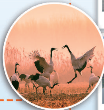
盐城湿地珍禽国家级自然保护区