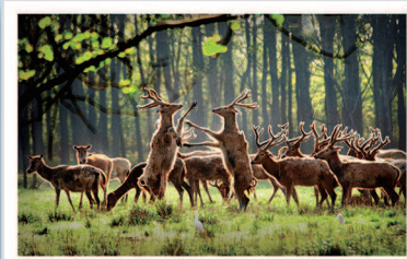
大丰麋鹿国家级自然保护区