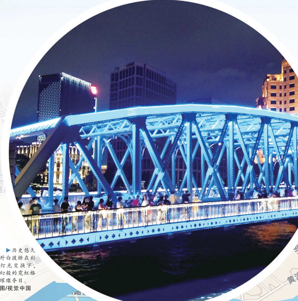
历史悠久的外白渡桥在彩色灯光变换下,梦幻般的霓虹格外耀眼夺目。

对老码头及工业产物进行更新和利用,改造设计出连接历史与艺术文化的都市滨水空间,将既有建筑和开放空间重新组织起来,使其更紧密地连为一体。跑步道与漫步道贯穿滨河起始,形成统一的整体空间。主要工程内容包括新建1500平方米彩色透水沥青跑步道、3200平方米漫步道,种植绿化1500平方米等。