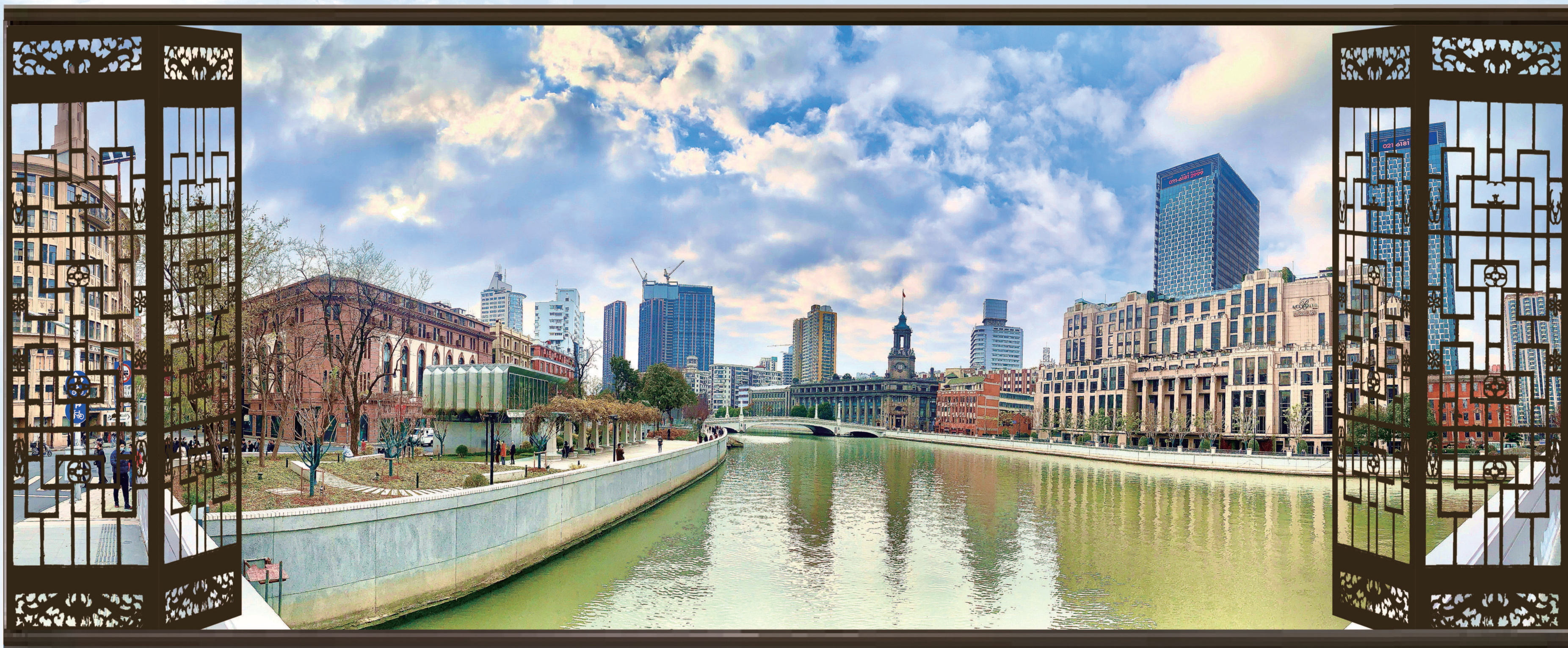
苏州河滨水公共空间景观提升改造后,成为公众休闲娱乐、健身运动、体验自然的崭新空间。