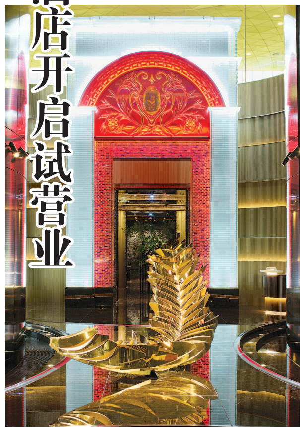
J酒店开启试营业。