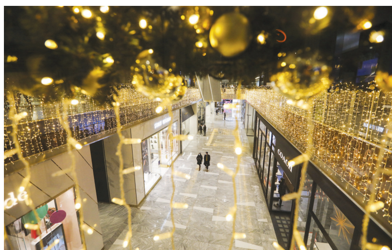
12月22日,在美国纽约,装饰一新的购物中心内顾客寥寥。

美国疾病控制和预防中心23日通报,全美单日新增新冠确诊病例近20万例,累计1817万例;单日新增死亡病例3165例,累计32.2万例。田纳西州以日均每十万人新增128人感染的速度,成为全美疫情新“震中”。尽管公共卫生专家呼吁民众在家过节,数以百万计美国人仍然选择出行。