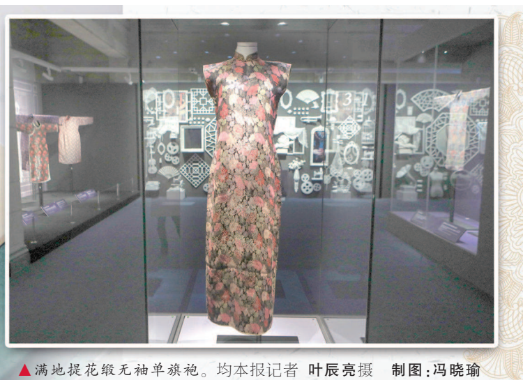
▲满地提花缎无袖单旗袍。均本报记者 叶辰亮摄 制图：冯晓瑜

述。据记载，中国古代的丝绸织造分为两个阶段：自商周至中唐为第一阶段，黄河中下游的中原、巴蜀地区是织造重镇，丝绸以经线显花为主。第二阶段始于中唐，丝织业逐步南移，至明清形成最为成熟的工艺，织造中心在江南。展厅显眼处，一件杏黄色夹袄，是清代中期织金妆花起绒类织物中的精品。这件夹袄是清代江宁织造所织，既是提花织物、织金织物，又是起绒织物。衣料的织造技术复杂，绒面割制平皱细腻，装饰风格独特，被定为一级文物。除了穿在身上，丝绸还是重要的写画材料，比如用于绘画的绢和裱画的线。一件露香园顾绣《山水人物图》以缎为地，先画后绣，以绣补画，颇具代表性。该图绣有“露香园”款识，钤有“毅庵主人九一八后得品”“看画轩”“静宽堂”