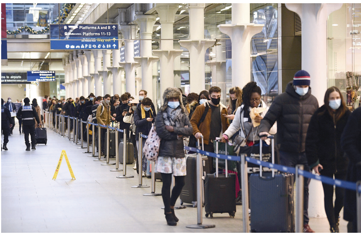
20日，法国暂停来自英国的人员入境。当天，在伦敦圣潘克拉斯车站，乘客排队登上最后一班往巴黎的火车。新华社发

本报讯 综合新华社消息，圣诞节临近，英国部分地区新冠病毒传播速度加快，疫情令人担忧。英国政府正在调查这一状况是否与一种变异的新冠病毒有关，并将首都伦敦、英格兰南部和东部部分地区的新冠疫情防控级别从第三级提升至新增加的第四级。 英国政府本月14日公布了出现变异新冠病毒的情况。卫生大臣汉考克当天说，一种变异的新冠病毒可能与英格兰南部病毒传播加快有关；类似的变异病毒已经在其他国家被发现，英国已将相关情况通报世卫组织。 汉考克20日说，政府不得不“快速、果断行动”，因为“这个新毒株失控了，我们必须控制住它，唯一办法是限制社交接触”。汉考克说，新毒株令英国疫情“极度严峻”，人们必须遵守规定。“考虑到这个新变种传播速度更快，难以在(全面)推出疫苗前控制住它。”他说，“这是今后数月要面对的”。 据英格兰公共卫生局介绍，这一变异病毒被命名为“VUI-202012/01”。目前在英国一些疫情较严重的地区，能够观察到较大数量的这种变异病毒感染病例。汉考克说，澳大利亚和欧洲大陆也发现了感染新毒株的病例。