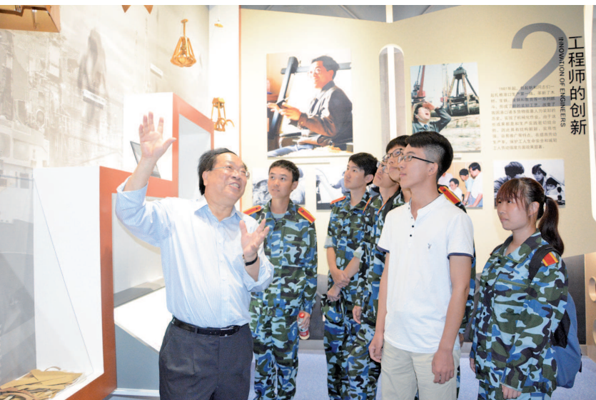
上图:全国劳模、“抓斗大王”包起帆校友在包起帆创新之路展示馆为学生讲述自己的创新发明历程