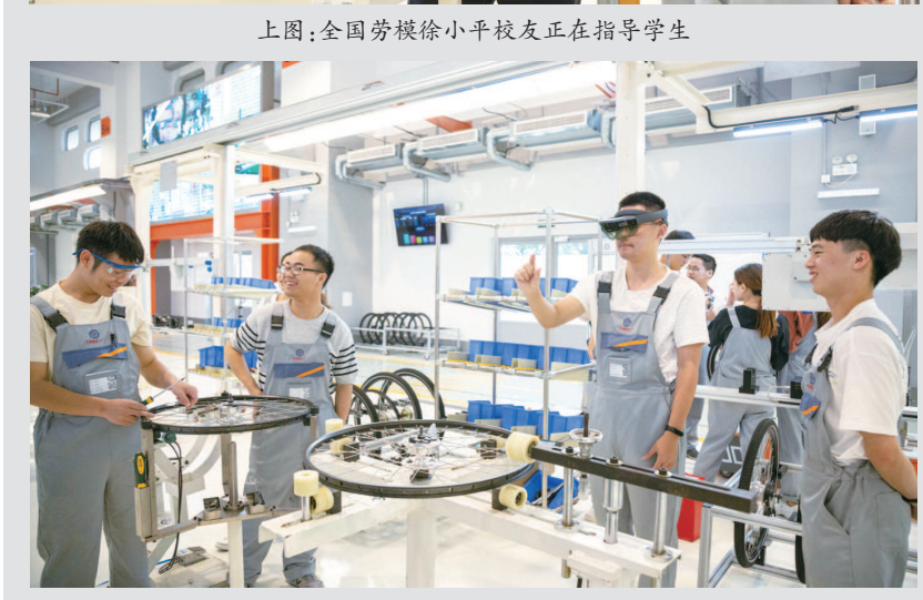
左图:学生进行工程实践