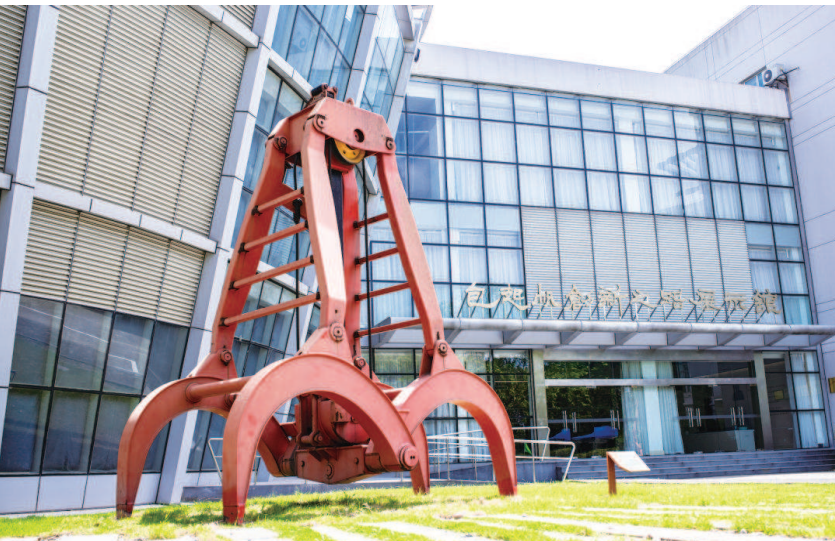
上图:包起帆创新之路展示馆