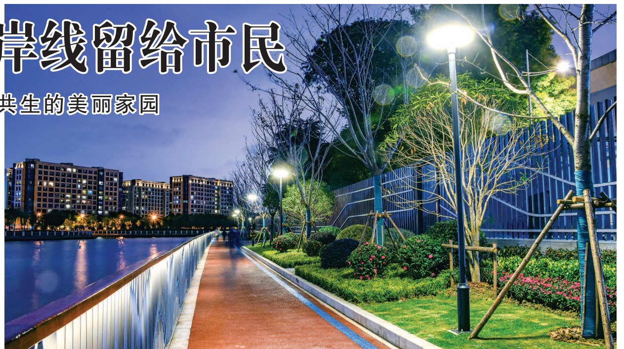
昨日,苏州河沿线健身步道海烟物流段正式建成开放。