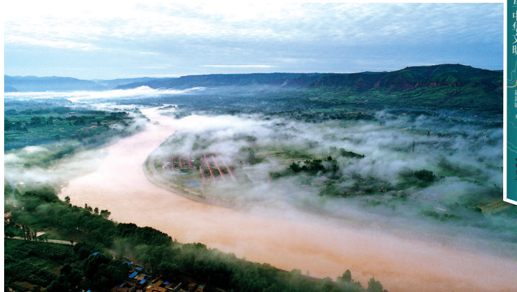
▲黄河古渡口，相传文成公主曾在这里渡河，远嫁吐蕃。

路。一部黄河史，就是中华文明的多民族文化融合的历史，独具特色。这些都沉淀在历史长河里，成为多民族交融的共同文化基因，也培育了中华文明对多样性的包容性品格。