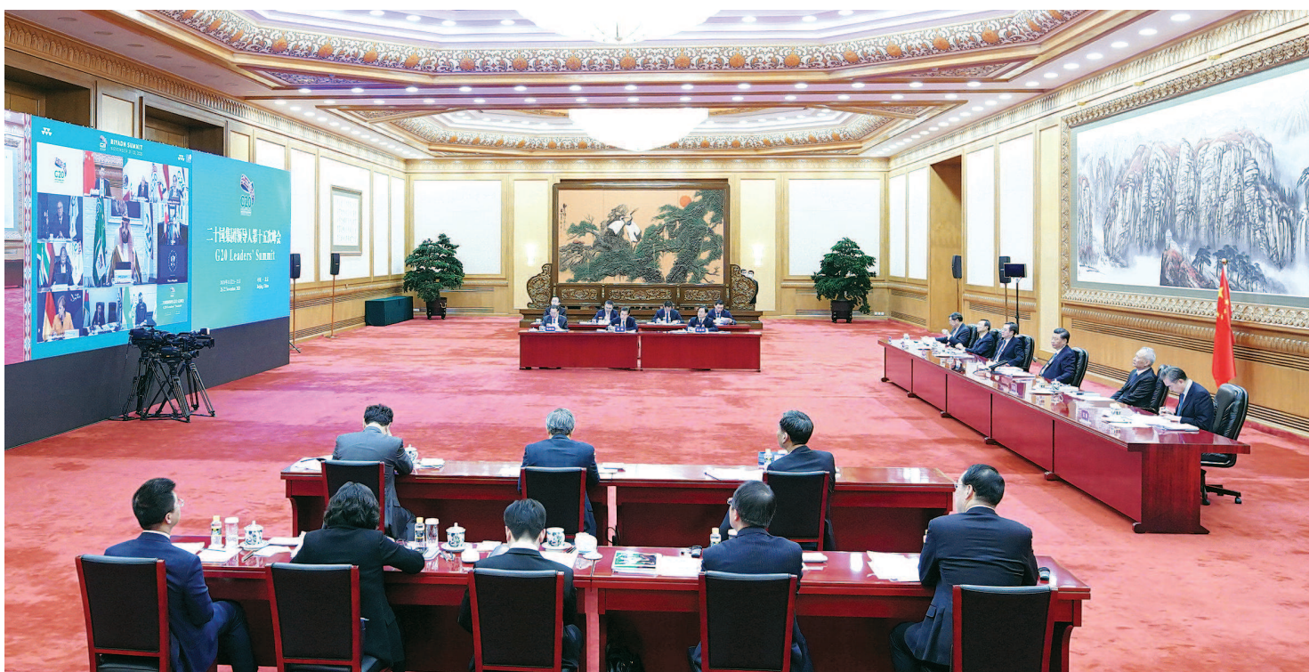
习近平在北京以视频方式出席二十国集团领导人第十五次峰会第一阶段会议。