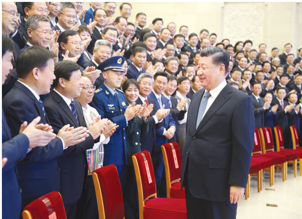
11月20日,习近平、王沪宁等在北京会见全国精神文明建设表彰大会代表。