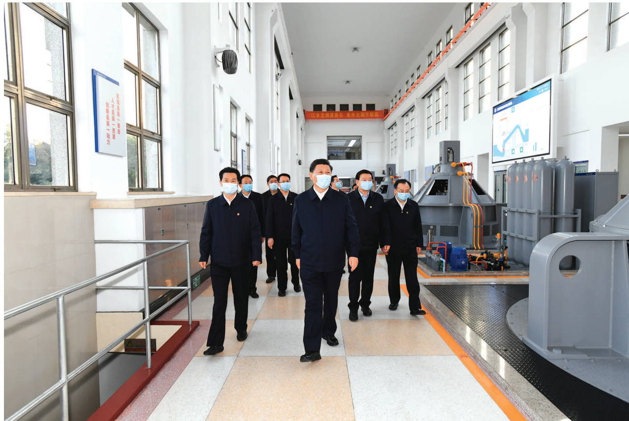
13日下午,习近平在扬州市江都水利枢纽第四抽水站,察看抽水泵运行情况。