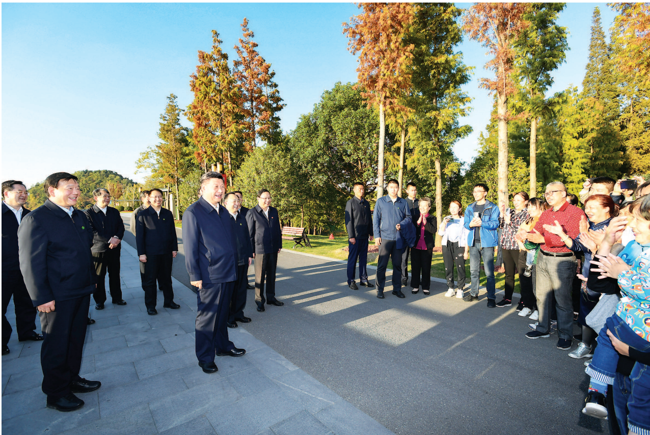
12日下午,习近平在南通市五山地区滨江片区考察时,同市民群众亲切交流。