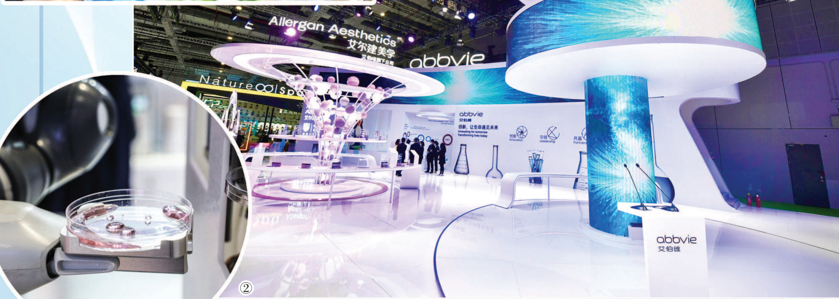
①进博会上,采购商与参展商洽谈采购合作事宜。 ②研究型生物制药公司艾伯维此次完成进博会“首秀”。 ③ABB医疗实验室预处理单元中,双臂YuMi协作机器人能够模仿人手完成复杂精细操作。