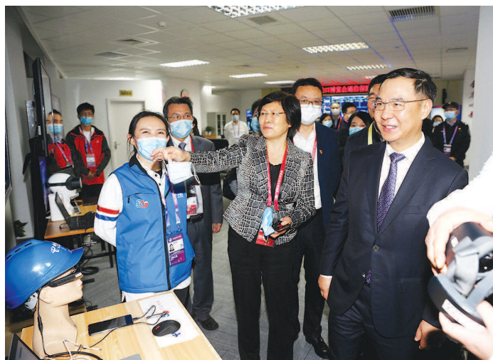
左图：在进博会通信保障指挥部，工信部领导正在听取上海电信5G版AR眼镜护卫进博会安全的汇报。