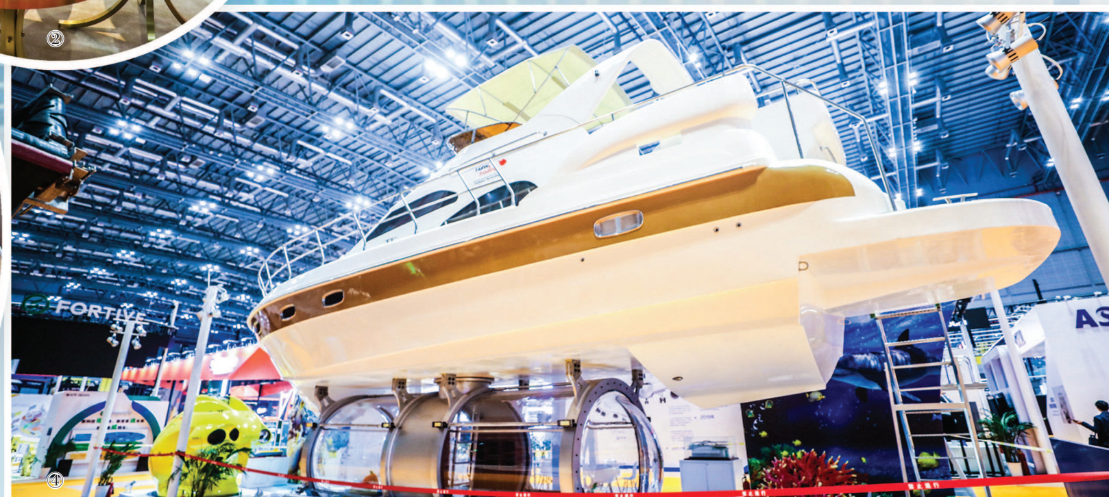
①法国时尚品牌 Lanvin 盛装亮相 ②鞋履品牌 Stuart Weitzman 展台 ③消费品展区一角 ④Tarw-Trading 展位上的全透明座舱观光艇