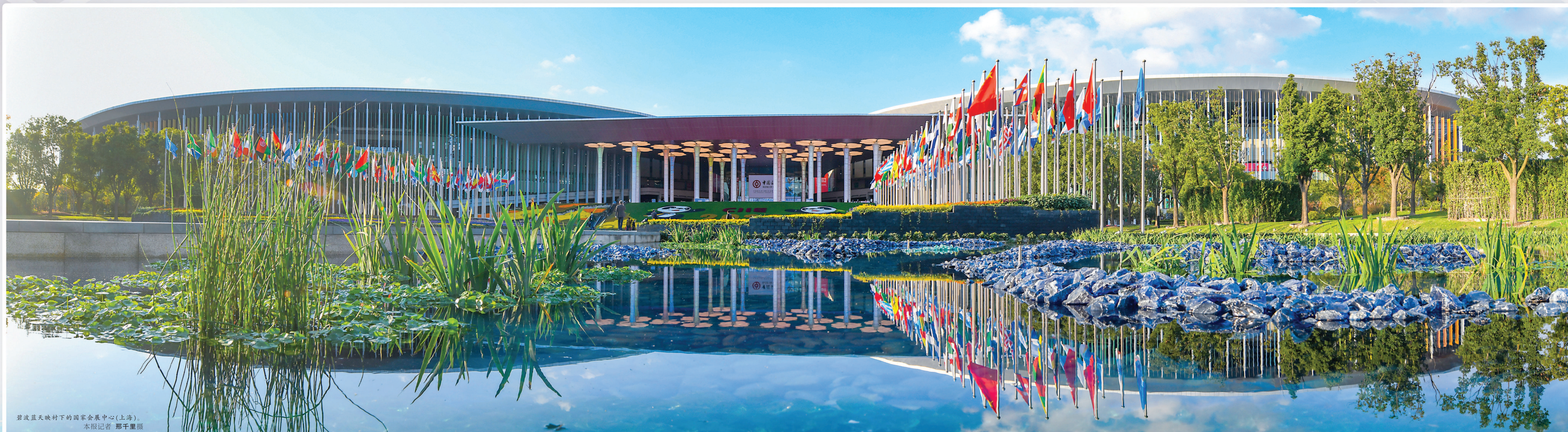
碧波蓝天映衬下的国家会展中心(上海)。