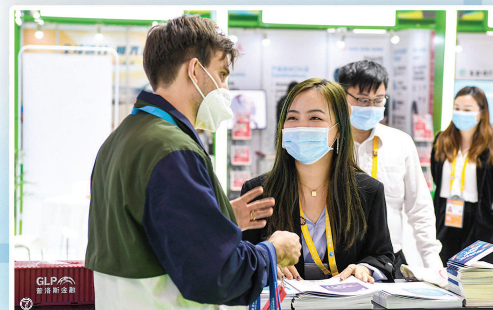
⑤本届进博会上的 高校志愿者。 ⑥接受采访的参展 嘉宾。 ⑦开展首日现场交 易火热。