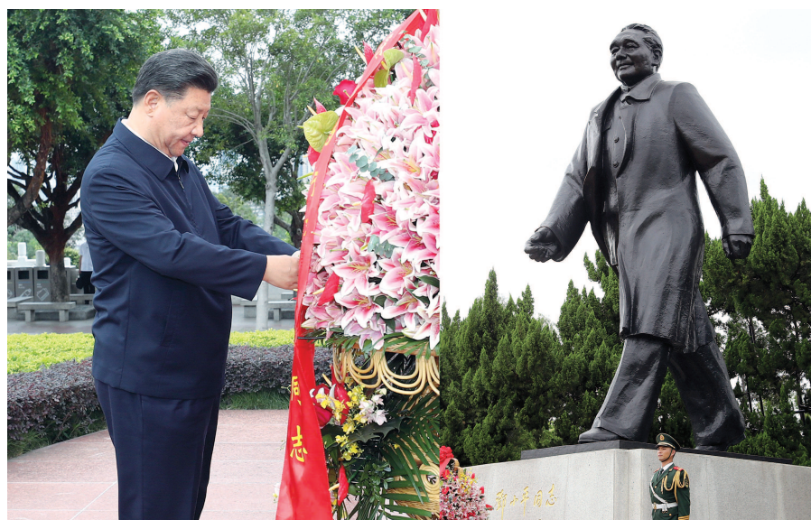
10月14日,深圳经济特区建立40周年庆祝大会在广东省深圳市隆重举行。中共中央总书记、国家主席、中央军委主席习近平在会上发表重要讲话。这是当天下午,习近平来到莲花山公园,向邓小平同志铜像敬献花篮。

国内统一连续出版物号 CN31-0002 国内邮发代号 3-3 国外发行代号 D123 客户端:文汇