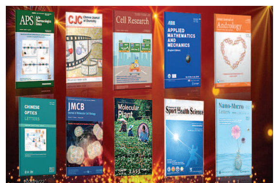
目前上海拥有各类期刊632种。

市委宣传部将牵头与相关部门共同建立推进上海期刊高质量发展的工作机制,聚焦上海优势领域和重点领域,围绕国家重大需求和科技发展战略必争领域重点布局;组建具有国际期刊审稿经验的高水平审稿队伍,推动学者专家尤其是科研工作者优先将一流成果的发布留在中国、留在上海