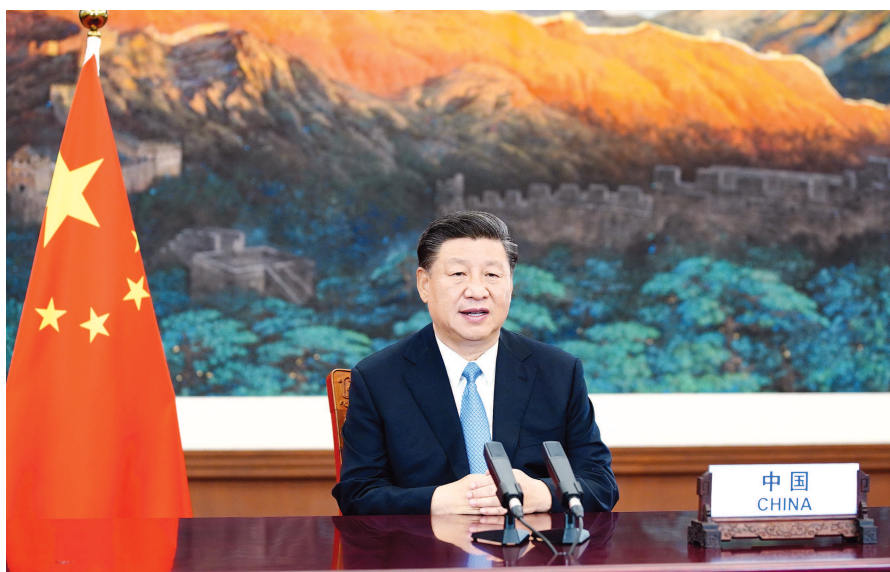
9月22日,习近平在第七十五届联合国大会一般性辩论上发表重要讲话。

国内统一连续出版物号 CN31-0002 国内邮发代号 3-3 国外发行代号 D123 客户端:文汇