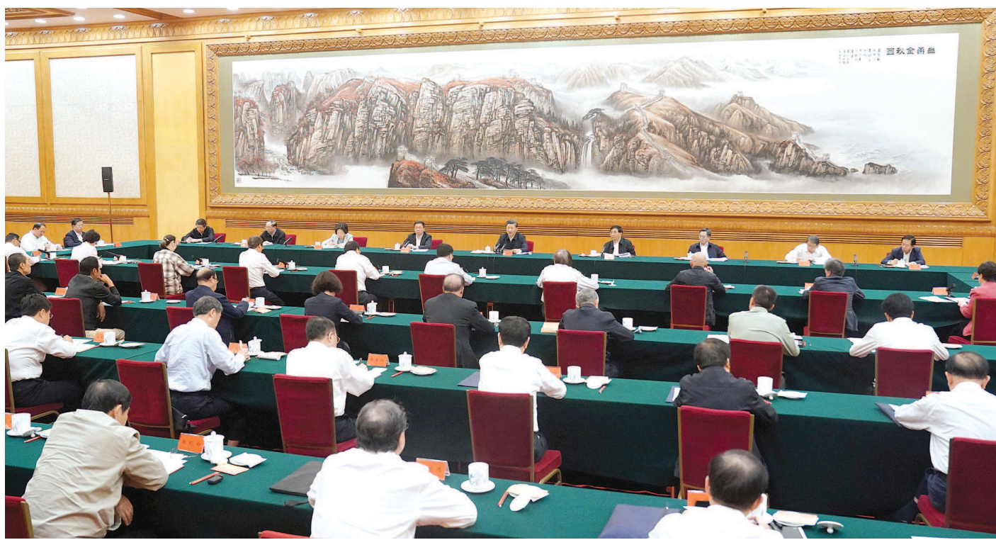
9月22日,习近平在京主持召开教育文化卫生体育领域专家代表座谈会并发表重要讲话。

“十四五”时期,要科学研判体育发展面临的新形势,坚持问题导向,聚焦重点领域和关键环节,深化改革创新,不断开创体育事业发展新局面