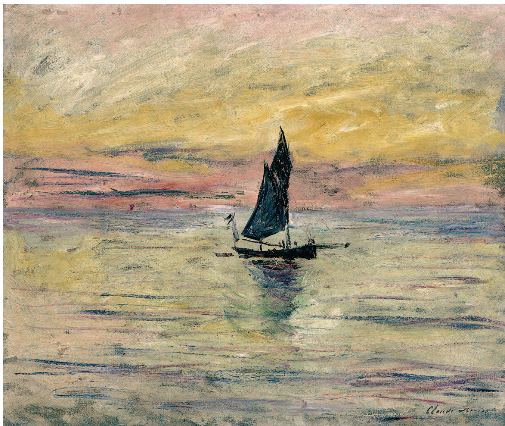
▲莫奈《帆船,夜晚印象》,1885

值得人们关注的,其实不仅仅是《日出·印象》本身,更是这幅画代表着一种什么样的艺术变革,推开了一扇什么样的通往艺术新世界的门。而此次展览除了《日出·印象》,还呈现了莫奈的《帆船,夜晚印象》《特鲁维尔海滨》《海滩上的卡米耶》等另外八幅作品,以及影响莫奈、受莫奈启发的一些作品。它们交相辉映出一个丰满的莫奈与印象派。