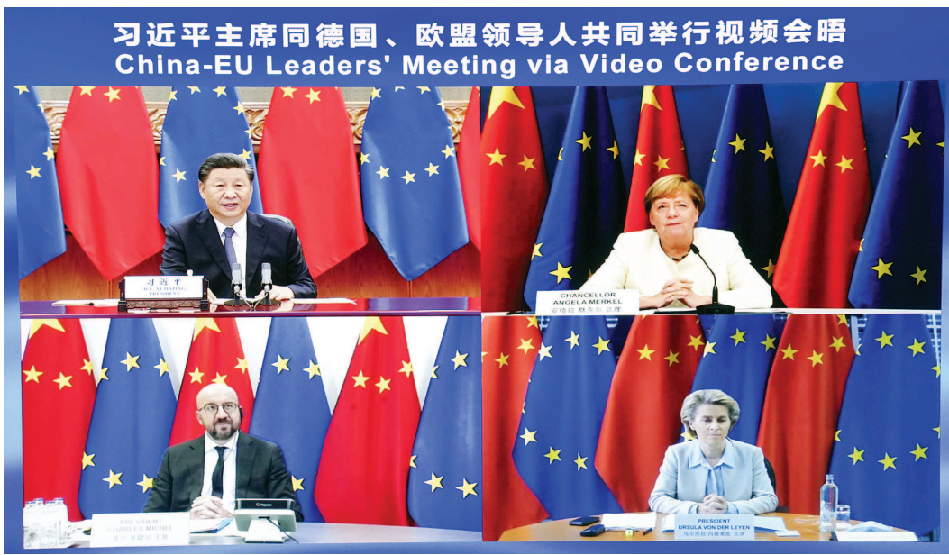
会晤以视频方式举行。