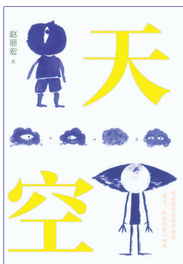
《天空》 赵丽宏著 人民文学出版社 天天出版社出版

这些成语,中国人都很熟悉,现在还经常在文字和口语中运用。简单凝练的四个字,却能将人间复杂的情感和态势表