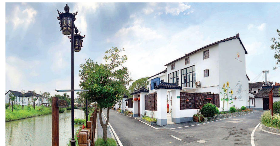
革新村颇具江南宅院中式建筑特色的民宿。