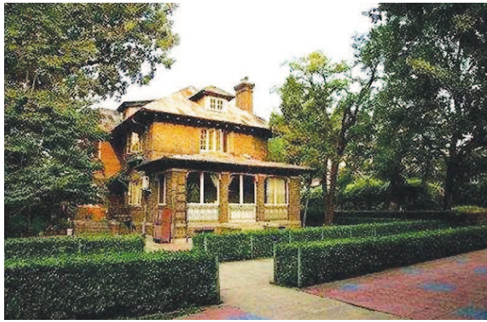
▲历经百年风雨,协和大院的16栋小洋楼仍顽强挺立。

之无愧。我曾经读过徐梵澄的文章,他一生崇敬与印度近代史上三圣之一的室利阿罗频多共同创建、主持阿罗频多修道院和阿罗频多学院、大力推广大瑜伽而举世闻名的密那氏,称之为“神圣的母亲”——虽然林巧稚大夫与密那氏没有可比性,然而在我看来,她们同样具有常人难以企及的执着事业的精神,都登极至“神圣”的地步。