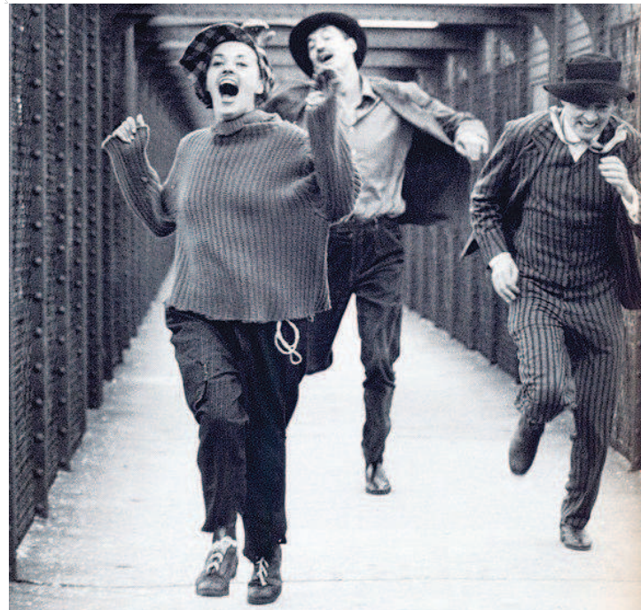
跑过的剧照令人过目不忘，让娜·莫罗跑在最前面

临终的好友，然后去了一个新书发布会，接着在街上漫无目的地行走，其间还目睹了一群小混混打架，最后他们到一个朋友举行的豪宅宴会……影片快结束时晨曦初露，夫妻俩漫步在一块草地上，妻子突然对丈夫说：“我不再爱你了。”可紧接着两人却抱在一起，滚起了“草地”。这正是安东尼奥尼想要通过动作和环境来揭示的人物复杂的内心世界。尽管这对中年男女相互倾诉、拥抱翻滚，可令人丝毫察觉不到他们之间还有爱，这是一对中产阶级中年夫妻维系婚姻的举动。让娜·莫罗出色地扮演了