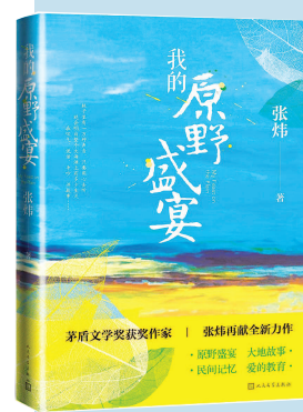
《我的原野盛宴》 张炜 著 人民文学出版社出版