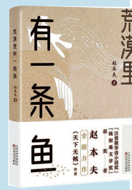
《荒漠里有一条鱼》 赵本夫 著 百花文艺出版社出版