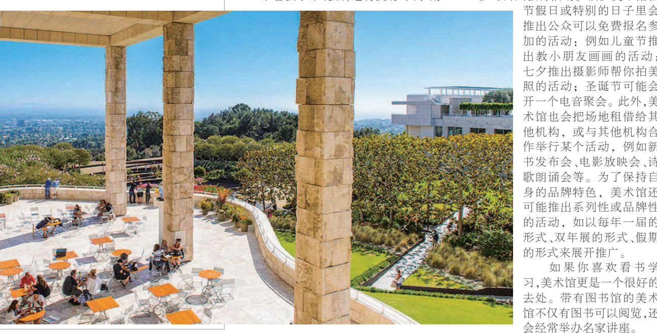
►洛杉矶的盖蒂美术馆看上去像个文化公园