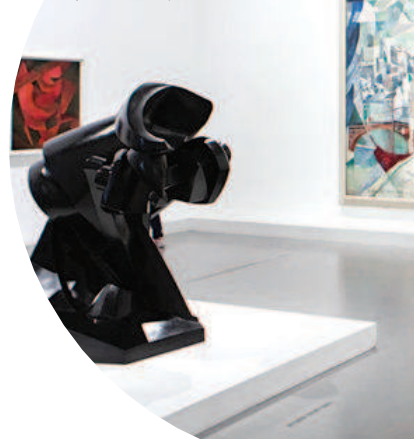
西岸美术馆正在举办的“时间的形态”蓬皮杜中心典藏展现场

间的介质，认为美术馆能让人完成视觉沉浸、代入、精神沉浸、交互性感官体验等，可以以艺术作品为介质，促成参观者与展览呈现者之间的对话。这无疑让美术馆有了新的追求。 “如果说我们需要找到一个地方，让我们暂时摆脱现实的枯燥感，消除倦怠，重振旗鼓的话，那个地方也许不是教堂而是美术馆。”青年作家祝羽捷以在国外不同的游历经历写下《人到了美术馆会好看起来》一书。在她看来，美术馆没有人们想象中那么严肃，而是可以做出一些改变，变得精致又好玩；美术馆也不应被视为某个终点，走出美术馆用审视艺术的目光看待生活，用诗意的眼光去观察世界，也许才是真正的开始。