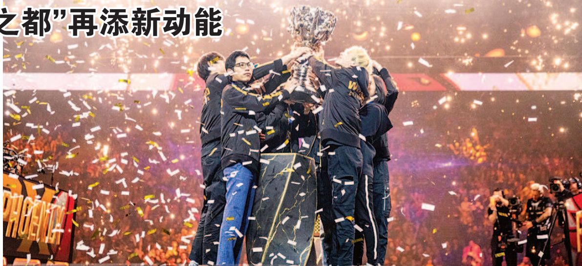
2019英雄联盟全球总决赛FPX夺冠现场。