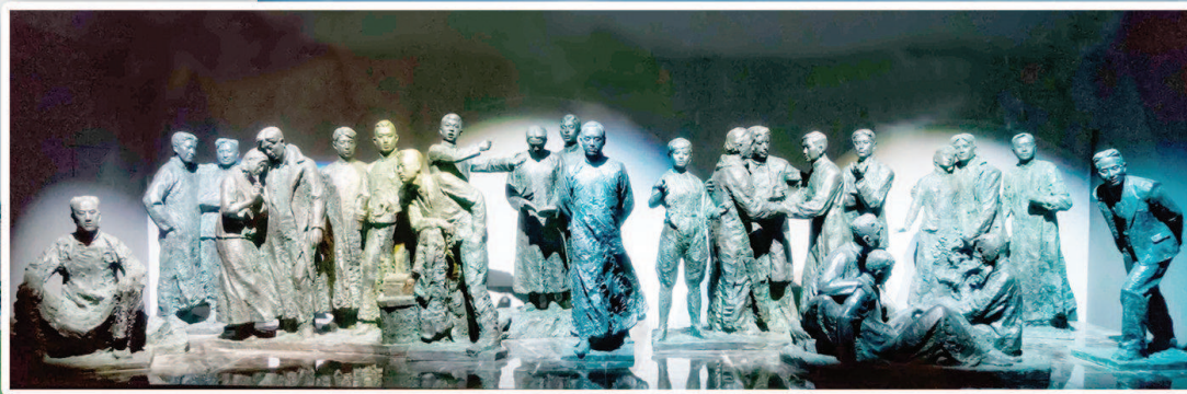
上图:上海龙华烈士陵园中的二十四烈士雕塑多媒体剧场 左图:上海龙华烈士陵园。 制图:冯晓瑜