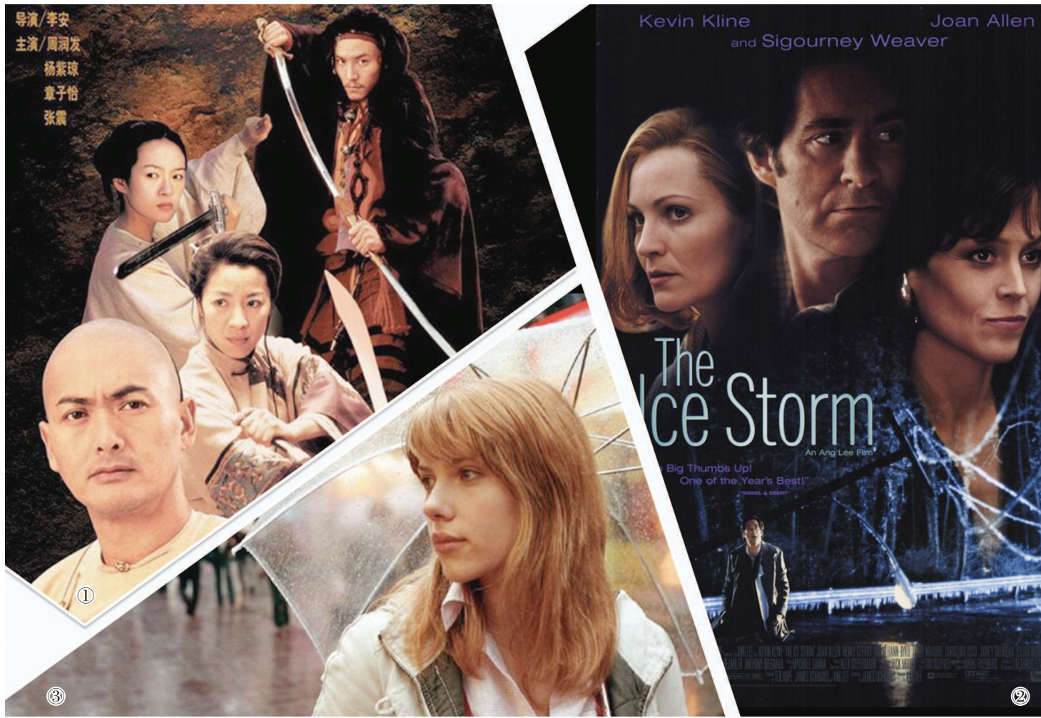
①《卧虎藏龙》海报。②《冰风暴》海报。③《迷失东京》剧照。

职业生涯见证中国电影一步步走向辉煌，可谦逊的他并不认为自己可以就此归纳中国电影发展的成功之处，进而指明未来的发展方向。每个国家的国情不同、文化不同，发展道路也不尽相同，在他看来，不能以好莱坞模式经验套用其他国家的产业发展之中。不过，他的观察却犀利地道出一点——那就是中国电影市场近二十年的爆发式增长与中国城镇化步伐息息相关。“简单一点来说，就是当中国大城市越来越多，发展越来越好，相应的反映人们精神生活水